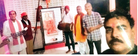
हरिभूमि न्यूज शाढ़ौरा