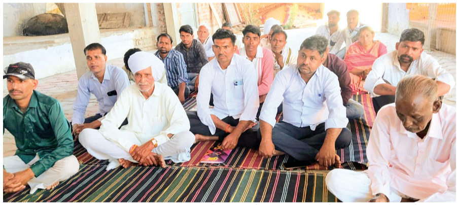
हरिभूमि न्यूज ▶▶ माचलपुर

मध्य प्रदेश जन अभियान परिषद योजना आर्थिक सांख्यिकीय के विभाग मध्य प्रदेश शासन जिला राजगढ़ विकासखंड जीरापुर द्वारा चयनित नवांकुर संस्था श्री महावीर