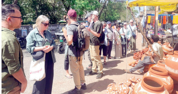
अशोकनगर